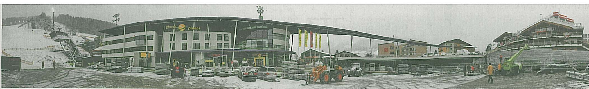
Das neue Zielstadion samt Planet Planai: Unterirdisch entstand ein 10.000 Quadratmeter großes Servicedeck für die Logistik der WM. Allein die Planai-Bahnen investieren 70 Mill. Euro.